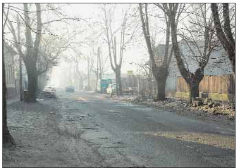
Ilyen volt a Csögyvár utca

(fűtési szezon: szeptember 15.–április 15.)