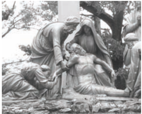
Lourdes-i keresztút, XIII. állomás Jézus testét anyja ölébe helyezik