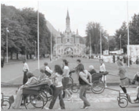
Betegszállítók Lourdes-ban háttérben a bazilika

isteni Fiával. Mária együtt szenved azokkal is, akik megpróbáltatást élnek át, velük együtt remél, és vigaszt nyújt nekik anyai segítségével. A sok beteg lelki tapasztalata vajon nem arról beszél, hogy egyre jobban megértsük: „az isteni Megváltó minden szenvedő ember lelkéig akar hatolni Szent Anyjának szíven keresztül, aki elsőként s a legtökéletesebben részesült a megváltásban”? (II. János Pál pápa Salvifici doloris kezdetű Apostoli Levele, 26.)